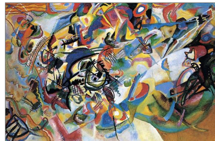
Vasilij Kandinskij, Composizione VII , 1913, Mosca, Galleria Tret'jakov

Un viaggio che continuerà anche nel 2021