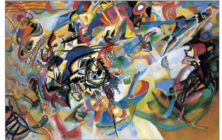
Vasilij Kandinskij , Composizione VII , 1913, Mosca, Galleria Tret'jakov

«La gestione armoniosa della faccia razionale e della faccia relazionale contraddistingue coloro che si occupano di Change Management, unitamente alla capacità di amalgamare gli aspetti tecnici con quelli umani .»